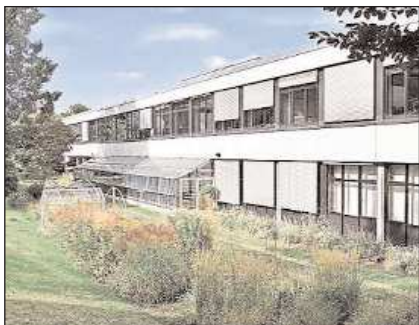
Es war einmal: die attraktiven Räume für Lehrende und Studierende inmitten des Botanischen Garten