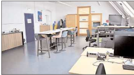
An Platz mangelt es nicht: Der Gründungsraum der HAWK bietet viel Raum für Kreativität.