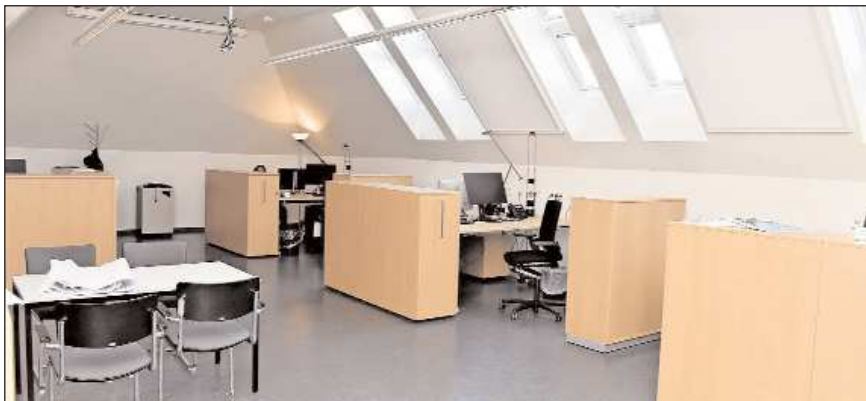
Moderne Lehre: In diesem Raum unterm Dach befinden sich acht Arbeitsplätze für Lehrende der Sozialen Arbeit.

Ziel aller beteiligten Stellen sei es, „zeitnah eine tragfähige und zukunftsorien-