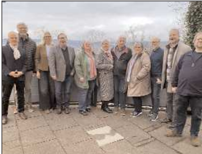
Der alte und neue Vorstand