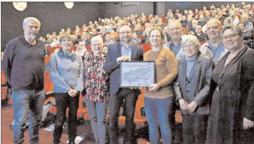
Die Neufassung der Dokumentation „Der Tag an dem sie kamen – Kriegsende 1945 im Gebiet der heutigen Samtgemeinde Boffzen“ von Jan Schametat hat im Roxy Kino eine beeindruckende Premiere gefeiert.

Ein Film, der es schafft, innerhalb 45 Minuten gleich mehrere Geschichten eindrucksvoll zu erzählen. Zum einen ist es das große Ganze: der Schrecken, die Absurdität und das Chaos der letzten Kriegstage. Zum anderen ist es vor allem die Weserüberquerung der amerikanischen Soldaten bei Fürstenberg und Wehrden. Das wohl beeindruckendste aber ist die Gefühlswelt jener Menschen, die genau das alles in Boffzen, Fürstenberg, Derental und Lauenförde erlebt haben. Echte Zeitzeugen-Interviews geben einzigartige