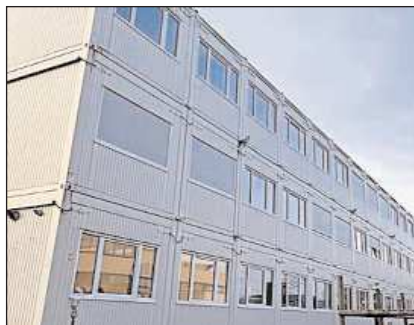
Herzlich willkommen in Detmold: So eine Containersiedlung wie in Lemgo könnte auch in Detmold für die Hochschul-Angestellten entstehen.