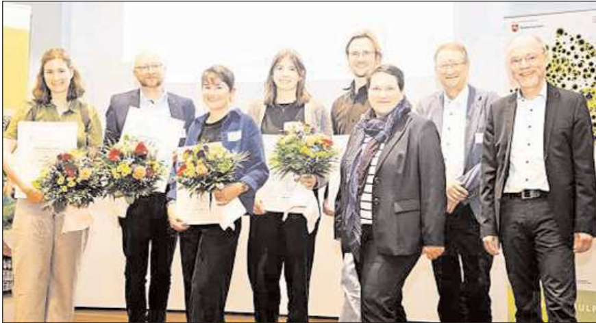
Die aktuellen Preisträger der Niedersächsische Akademie Ländlicher Raum (ALR).