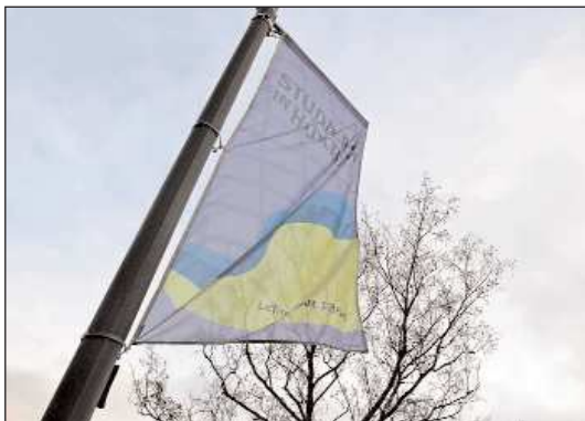
An der Wilhelmshöhe hängen die neuen Fahnen vor dem Gebäude der Technischen Hochschule Ostwestfalen-Lippe.

Müssen sich die Mitarbeitenden des Campus Höxter nach der drohenden Zwangsumsiedlung denn so etwas auch noch gefallen lassen, fragt sich der Aktionskreis? „Sollte diese Unterbringungsform Realität werden, wird sich das dramatisch auf die Motivation der Be-