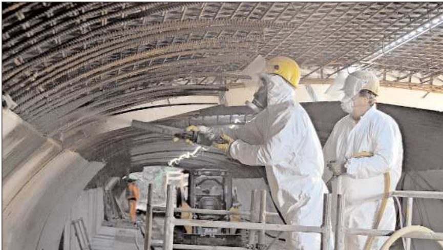
Mit rund 3 Bar Druck wird der Spritzbeton Schicht für Schicht auf die Tunneldecke aufgetragen.

Die Baumaßnahme in Holzmindens Innenstadt hat es in die Top 100 der wichtigsten Brückensanierungen geschafft, die das Land Niedersachsen gerade abarbeitet. Der Grund: „Die Brücke über die Holzminde“ ist - nach mehr als 120 Jahren - in ihrer Tragfähigkeit eingeschränkt. Damals wurde die Herrenbache, wie die Holzminde hier